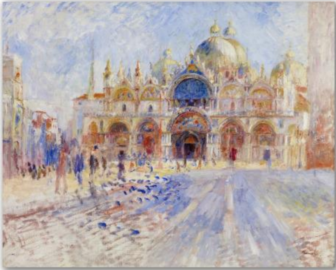
Plaza de San Marcos. Pierre-August Renoir. 1881.