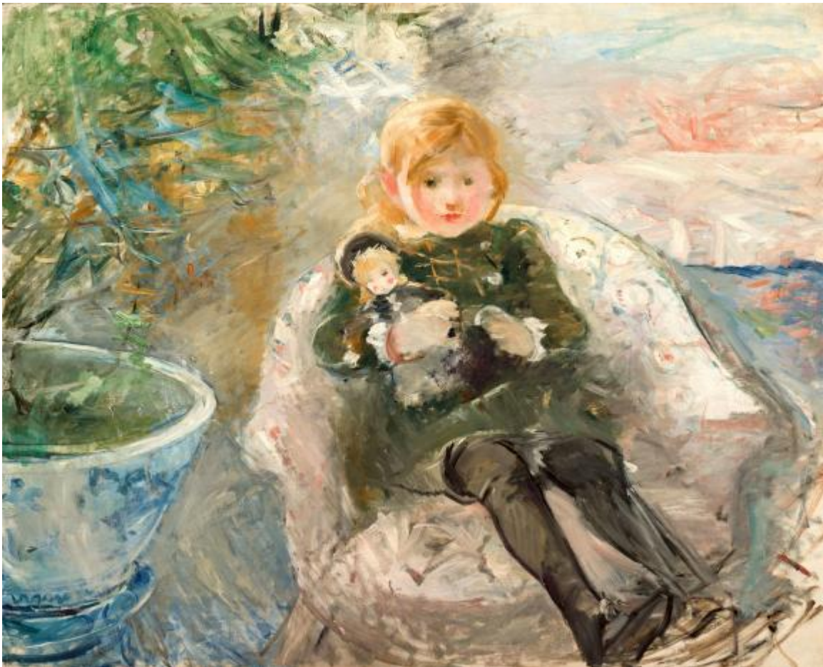
Niña con muñeca, Berthe Morisot. 1884.